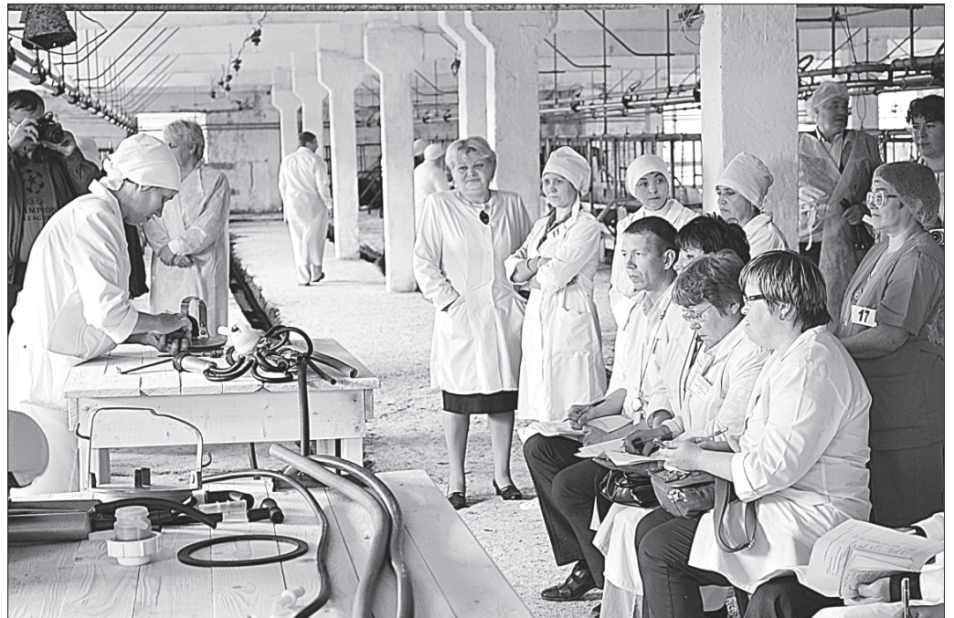
За разборкой-сборкой доильного аппарата участница из Инты.