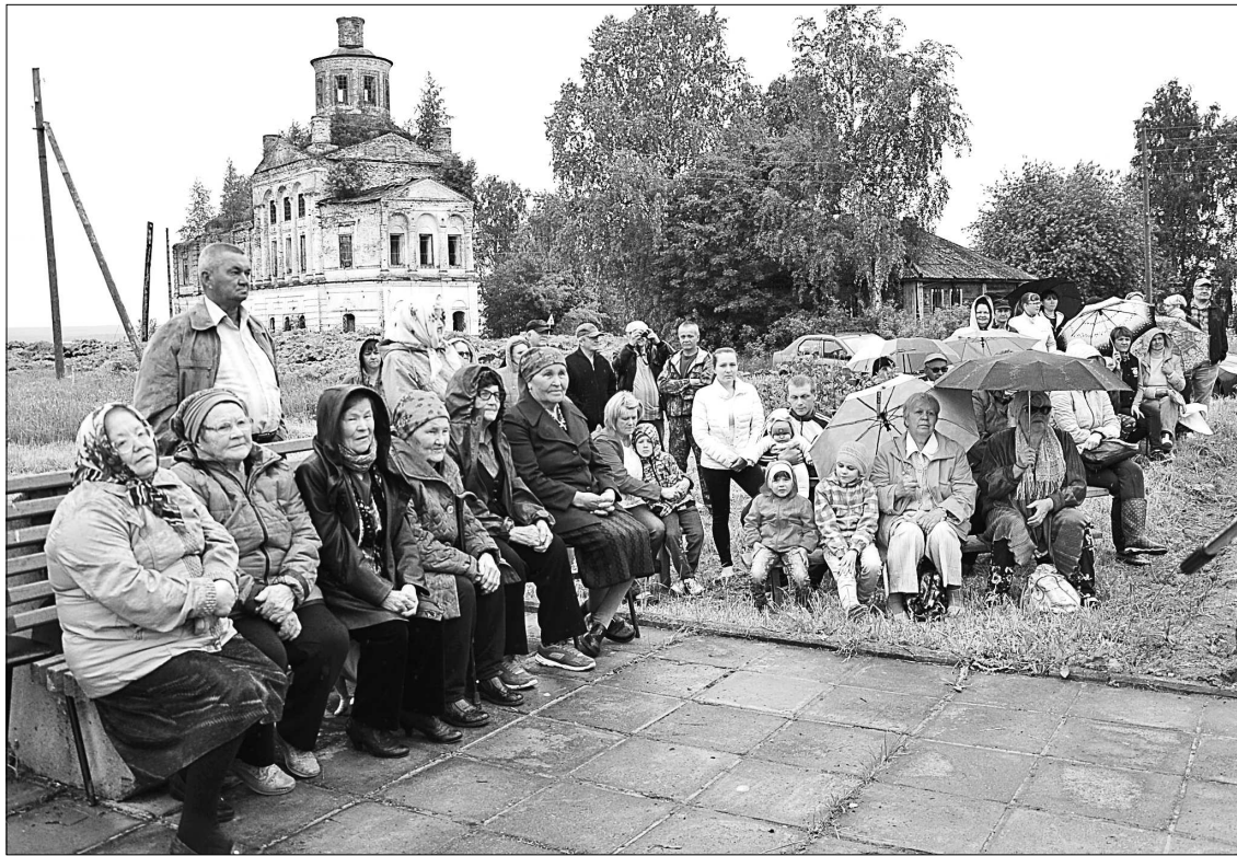
Жители и гости села.

Несмотря на начавшийся затяжной дождь, зрители не спешили расходиться. Да и артисты полностью отработали концертную программу. С по-