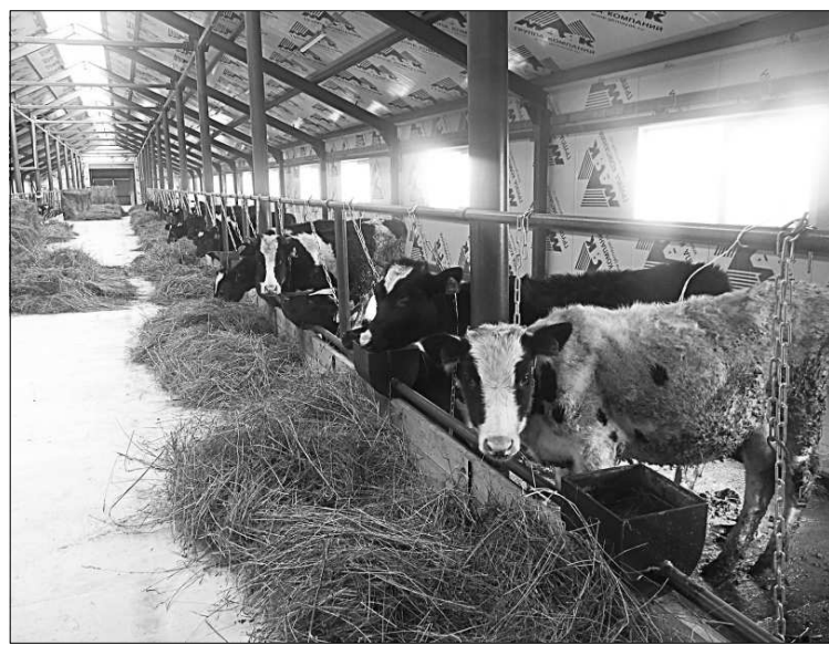
В новом телятнике.

зано с тем, что в прошлом году закупили достаточно много телёнок, что и повлияло на общий результат по надоям. Обновление стада, его воспроизводство и повышение за счёт этого продуктивности - это дело времени. Завершив сельхозработы, начали подготовку к следующему году. В этой связи произвели закуп семенного материала картофеля элитных, высокоурожайных сортов. Закупаем и семена однолетних трав. Что касается экономической стороны дела, нынешний год закончим «по нулям».