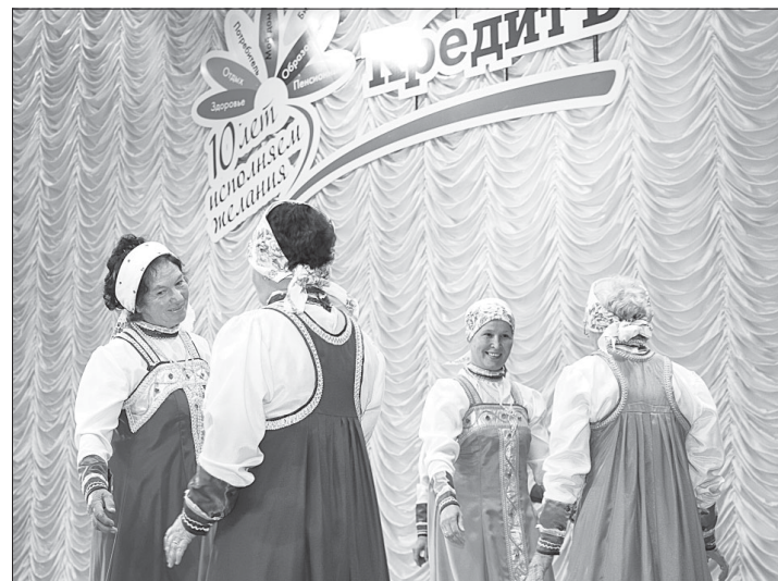
Ансамбль «Подруженьки» РДК на юбилейном концерте КПК «КредитЪ».