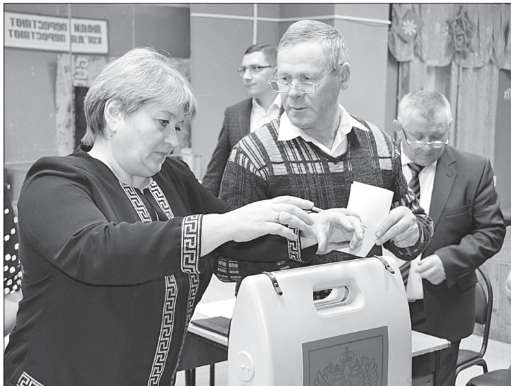
Идёт тайное голосование.

Председатель вручил благодарственные письма администрации МР «Сысольский» главам сельских поселений