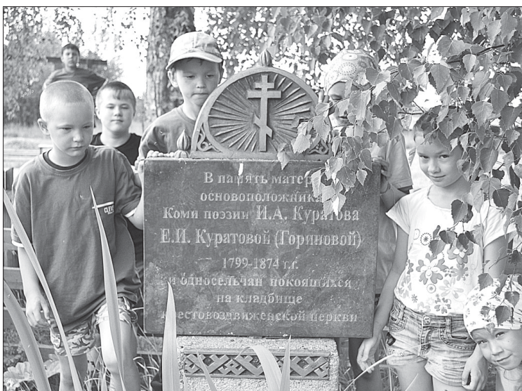
У памятной доски матери И.А. Куратова в Чухлэме.