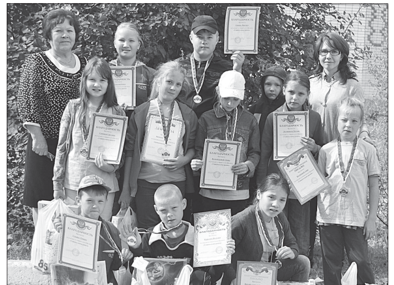
Участники проекта в завершающий день.

Профилактическая работа с детьми осуществлялась посредством проведения бесед с показом документальных, короткометражных художественных фильмов, иллюстраций, видеороликов «Вредные привычки», «Маленькая спичка – большой пожар», «Будь внимателен на дороге», «Я – пешеход!», «Запомни сам и расскажи другим», «Табачный дым – враг здоровья», «Интересно жить без...», «Хорошо плохо» и другие. На таких встречах дети узнавали о важ-