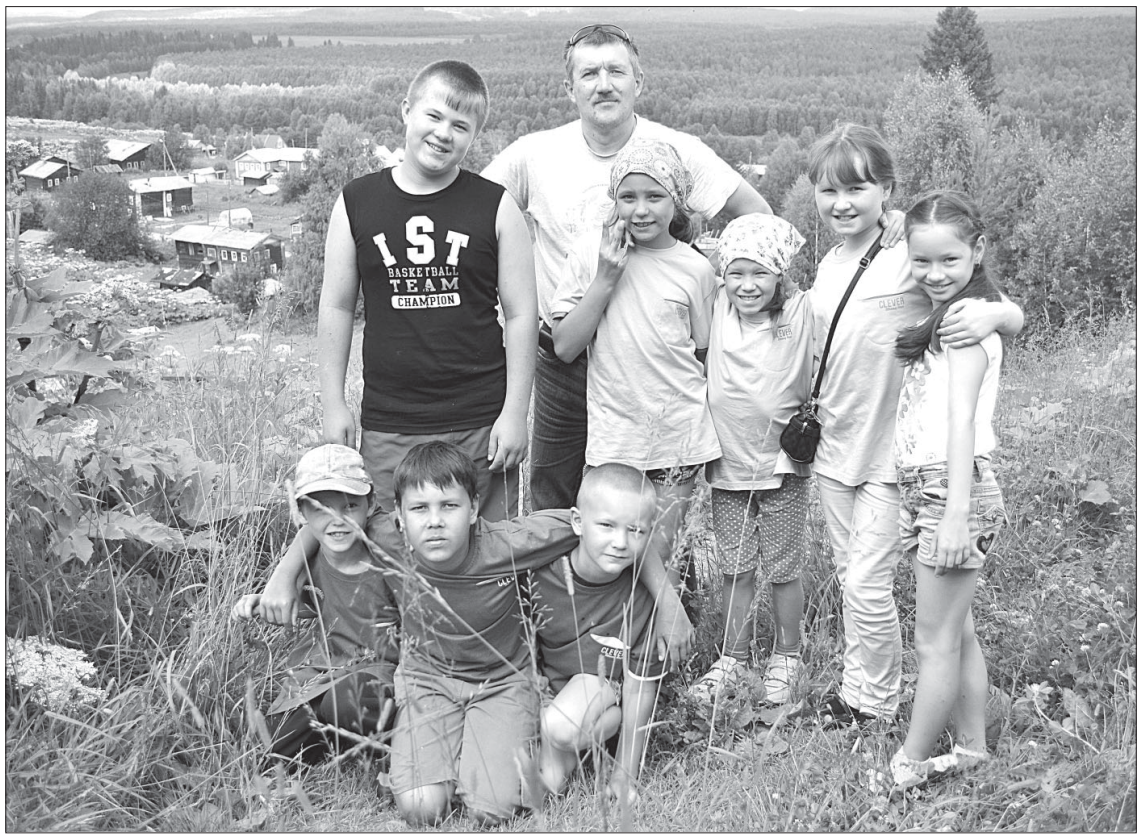
С экскурсией в Чухлэме.

НА ПРОТЯЖЕНИИ последних трех лет отделение социальной помощи семье и детям Территориального центра социального обслуживания населения ГБУ РК «Центр по предоставлению государственных услуг в сфере социальной защиты населения Сысольского района» участвует в различных конкурсах проектов и программ Фонда поддержки детей, находящихся в трудной жизненной ситуации, и иных фондов, организаций, учреждений. За счет средств бюджета Республики Коми получает финансовую поддержку. И 2014 год не стал исключением. Социальный проект «Удивительное рядом» с элементами краеведения, направленный на работу с несовершеннолетними и их семьями, был определен и выбран как соответствующий требованиям конкурса.