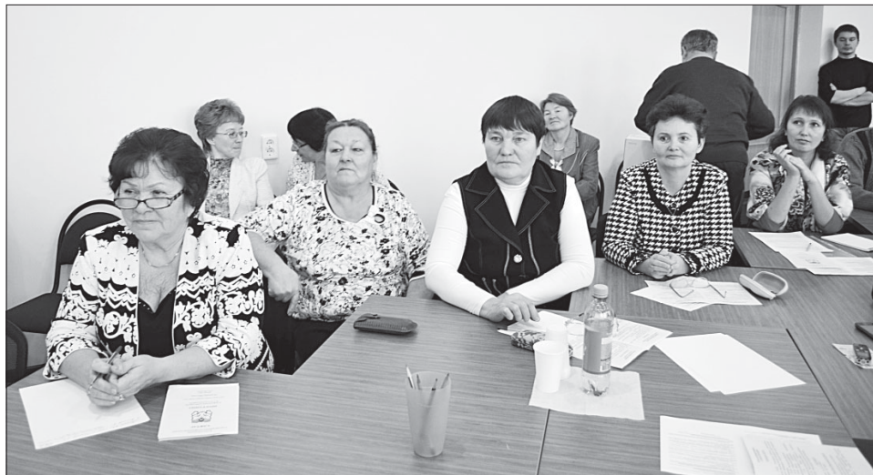
Участники и делегаты конференции коми народа Сысольского района 16 декабря 2013 года.