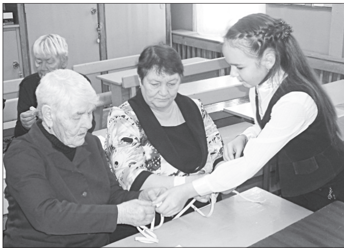
Во время мастер-класса.

Этот праздник в России начал праздноваться с 2009 года по инициативе голландского Цветочного бюро. Отсюда появилось и ставшее традиционным праздничное подношение бабушкам и дедушкам - горшечное комнатное растение, символизирующее многолетний жизненный цикл семьи, от ее корней и до самых последних юных ростков. Дата празднования - 28 октября - тоже выбрана не случайно, она полностью совпадает с датой проведения древнеславянского праздника почитания семьи.