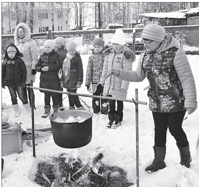
Капуста получилась на славу.

Пока капуста варилась, с детьми игровую програм-