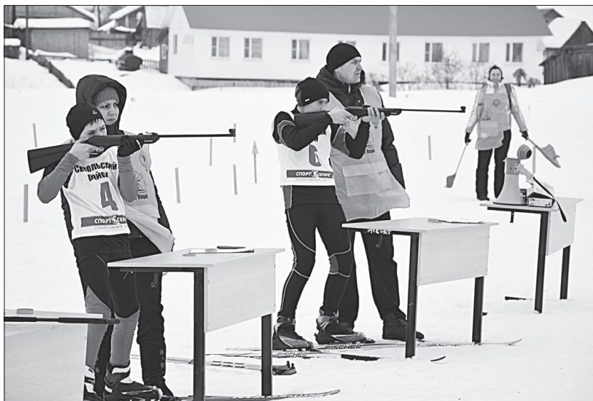
На огневом рубеже.

Участники возрастной группы 15-16 лет и 17 лет и старше бежали на круг больше и проходили дополнительный огневой рубеж. В случае непопадания биатлет обес-