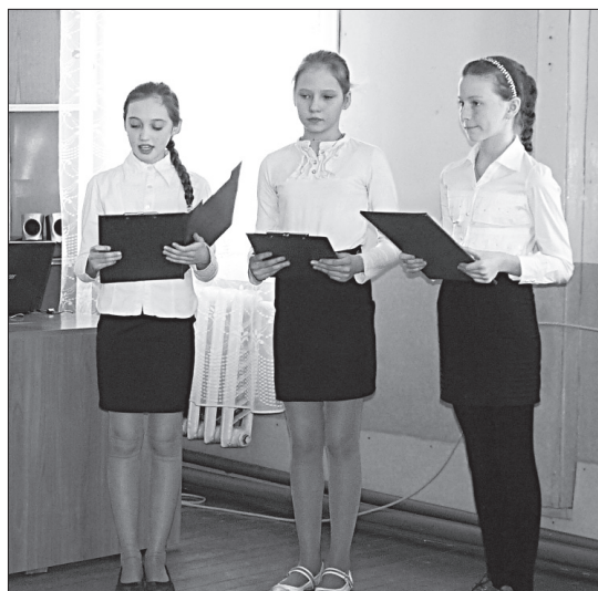
На защите проекта обучающиеся РЦДТ.

Непосредственно защита социальных проектов с устной презентацией материалов и подведение итогов конкурса прошли в конце февраля. Здесь рассматривались не только содержательность проекта в презентации, но и четкость и лаконичность выступления, культура речи, умение аргументировать свои ответы на вопросы.