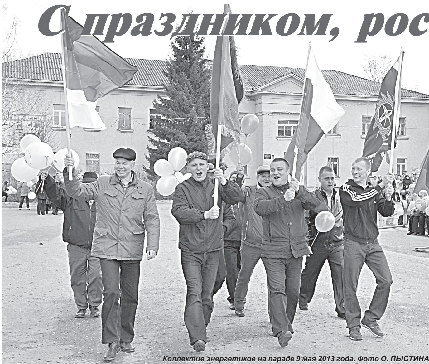
Коллектив энергетиков на параде 9 мая 2013 года.

Уважаемые жители Республики Коми! Дорогие земляки!