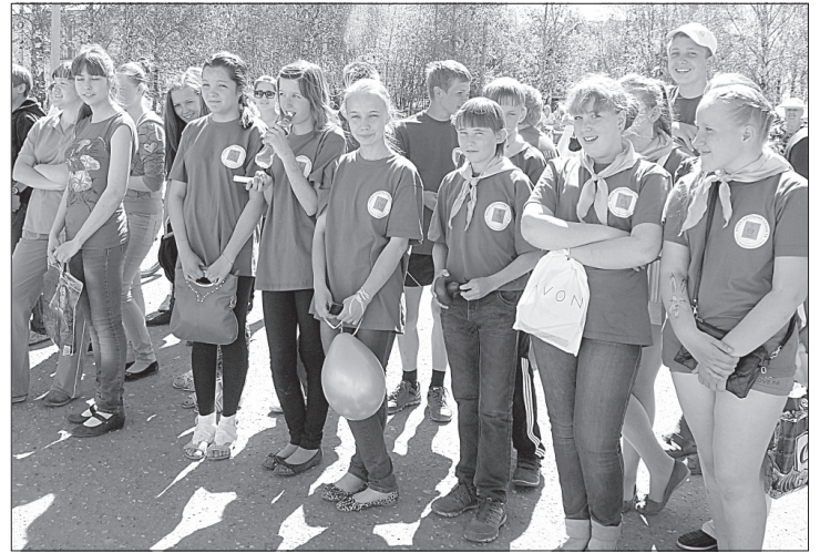
Отряд «Наша школьная планета» из с. Визинга.

ПЕРВЫЙ день лета выдался солнечным и тёплым. На площади райцентра с раннего утра собрались дети и их родители на праздник детства.