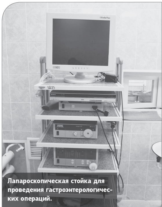
Лапароскопическая стойка для проведения гастроэнтерологических операций.