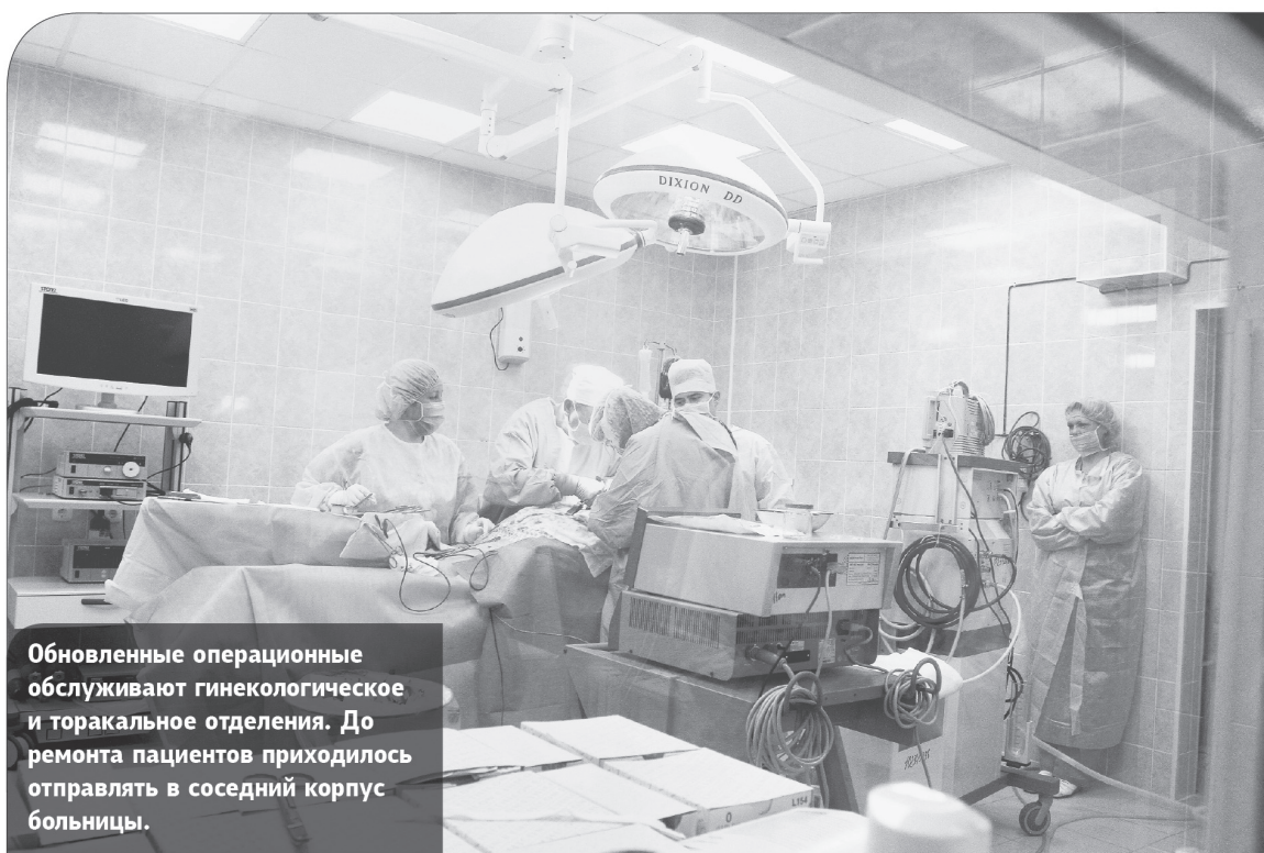
Обновленные операционные обслуживают гинекологическое и торакальное отделения. До ремонта пациентов приходилось отправлять в соседний корпус больницы.