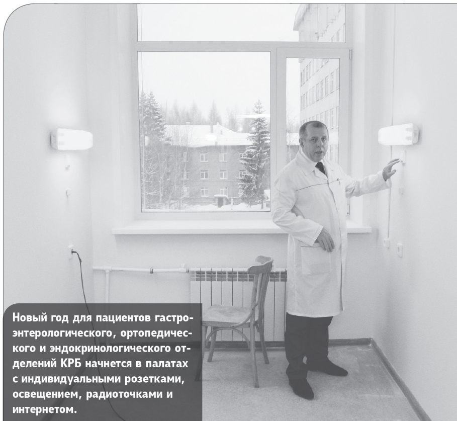
Новый год для пациентов гастроэнтерологического, ортопедического и эндокринологического отделений КРБ начнется в палатах с индивидуальными розетками, освещением, радиоточками и интернетом.