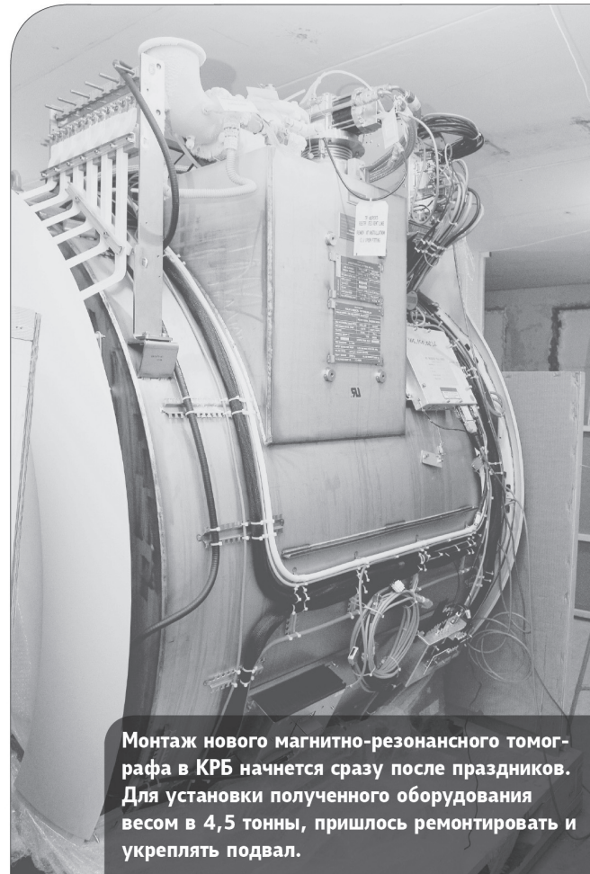
Монтаж нового магнитно-резонансного томографа в КРБ начнется сразу после праздников. Для установки полученного оборудования весом в 4,5 тонны, пришлось ремонтировать и укреплять подвал.