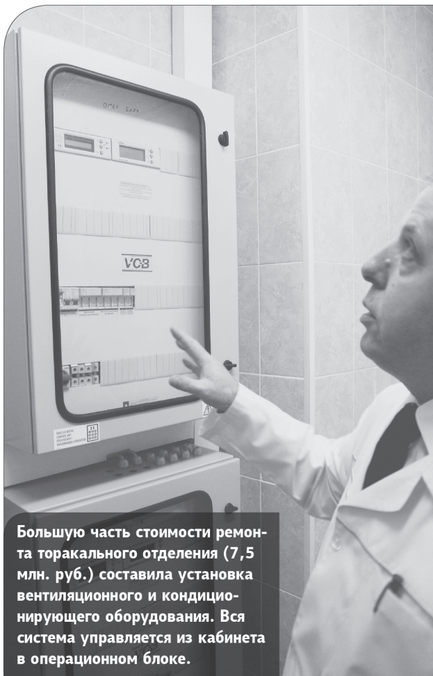
Большую часть стоимости ремонта торакального отделения (7,5 млн. руб.) составила установка вентиляционного и кондиционирующего оборудования. Вся система управляется из кабинета в операционном блоке.