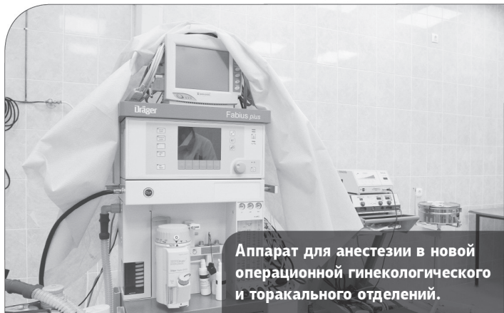
Аппарат для анестезии в новой операционной гинекологического и торакального отделений.