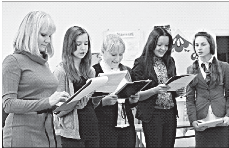
Во время программы «С вами работает профессионал».

хотелось занять призовое место, но и этот результат нас не расстроил, напротив, подогрел наш интерес к спортивным видам состязаний.