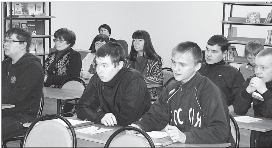
Участники ярмарки вакансий.

На ярмарку специалистами ГУ РК «Центр занятости населения Сысольского района» были приглашены представители учреждений и частные предприниматели района, где востребован труд автомехаников и водителей категории «С».