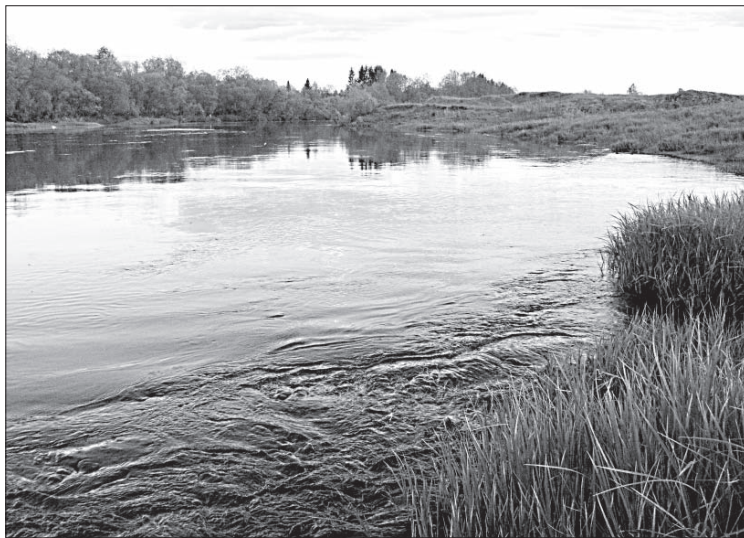
евские в д. Рай».

Вдоль больших пригорков, холмов и оврагов, со всех сторон д. Рай устремляются и текут речушки: с юга - Пола шор, с запада - Вудж шор, с севера - Кычаньб шор, которые несут свои воды в р. Большую Визингу. Особенно они бурлят весной, а летом почти высыхают. Сколько прошло здесь больших и незначительных событий? Сколько поколений выросло на берегах Большой Визинги? А она, как и прежде, течет плавно,