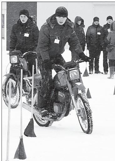
На этапе по техническому многоборью.

В техническом многоборье команда Визингского филиала РЦДО заняла первое место, второе за командой Визингского филиала КРАПТ, третье – у команды