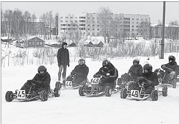
Соревнование на картах.

В целом следует отметить, что состязания в этот день были очень увлекательными, приходили и болельщики, в