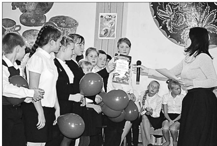
Вручение памятных дипломов.

ственному мероприятию подготовил творческий номер: учащиеся 5 «а» класса исполнили частушки про всех учеников в классе, 5 «б» - песню про пятиклассников, а 5 «з» построил своё выступление на лирических мотивах. Все были настоящие молодцы, отлично справились с творческим заданием.