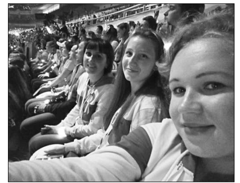
На открытии фестиваля.