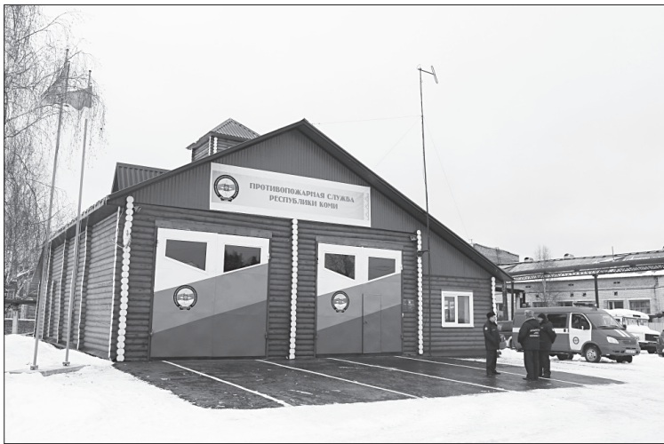
Новое здание отдельного поста.

В ПЯТНИЦУ, 30 октября, в селе Куниб состоялось открытие нового здания пожарного депо, которое своими силами возвели огнеборцы отдельного поста №1 ПЧ-131.