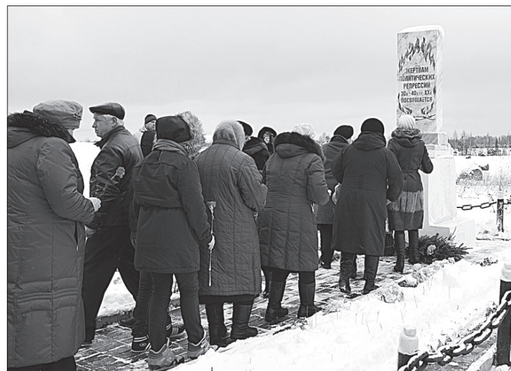
30 октября 2015 г.

Нужно помнить, что памятник установлен не только жертвам политических репрессий п. Ниашор. В те годы Койгородский район входил в состав Сысольского района. Место установки памятника выбрано по причине близости основной автотрассы, а население Койгородского района, проезжая наш район, может остановить-