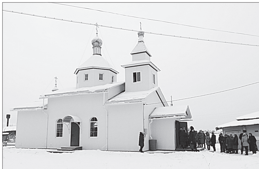
Церковь пророка Иоанна Предтечи.

Освятил новый храм епископ Сыктывкарский и Ворку-