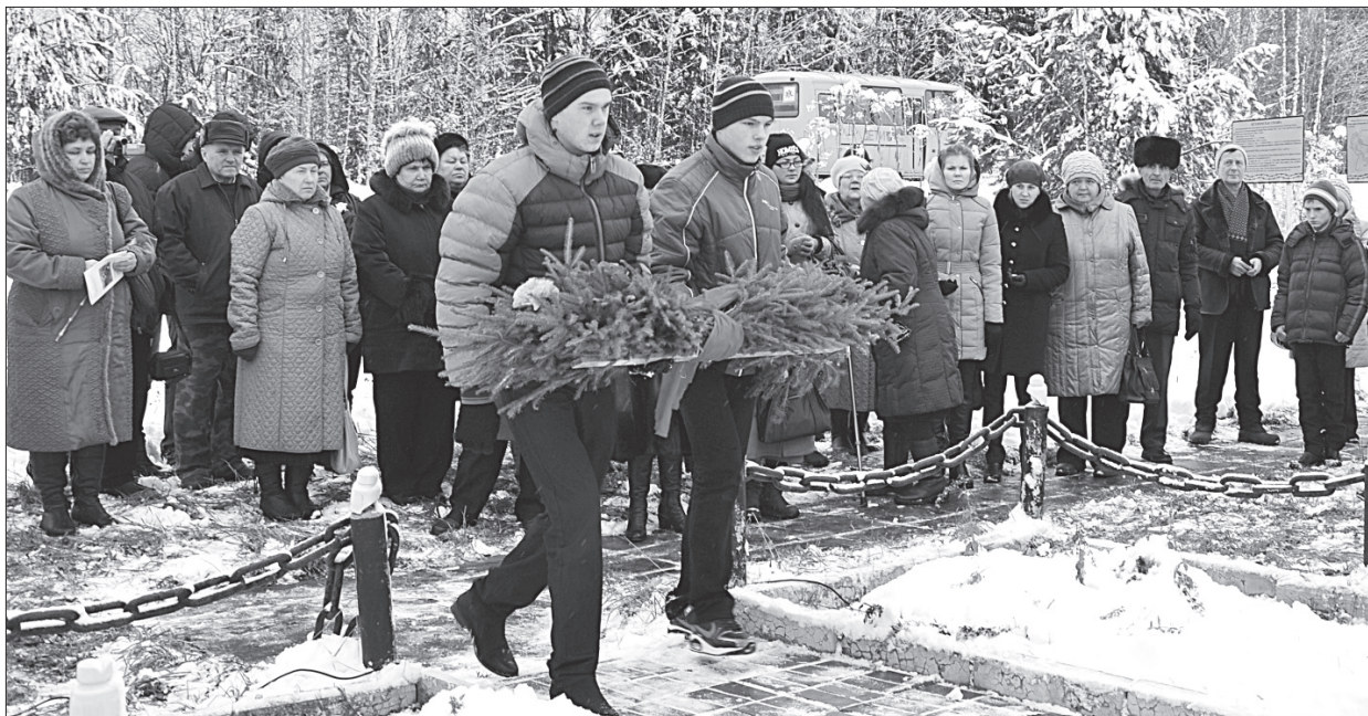
Старшеклассники Первомайской школы возлагают гирлянду.