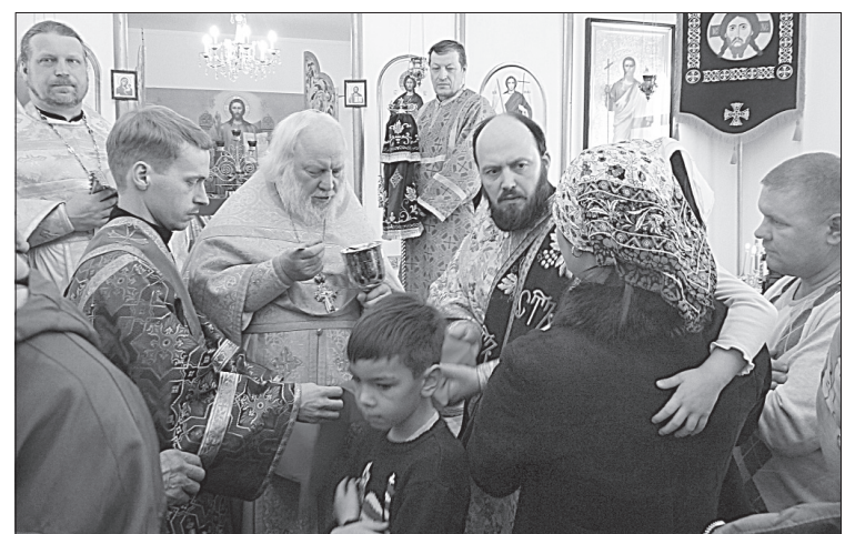
Первое причастие в новой церкви.