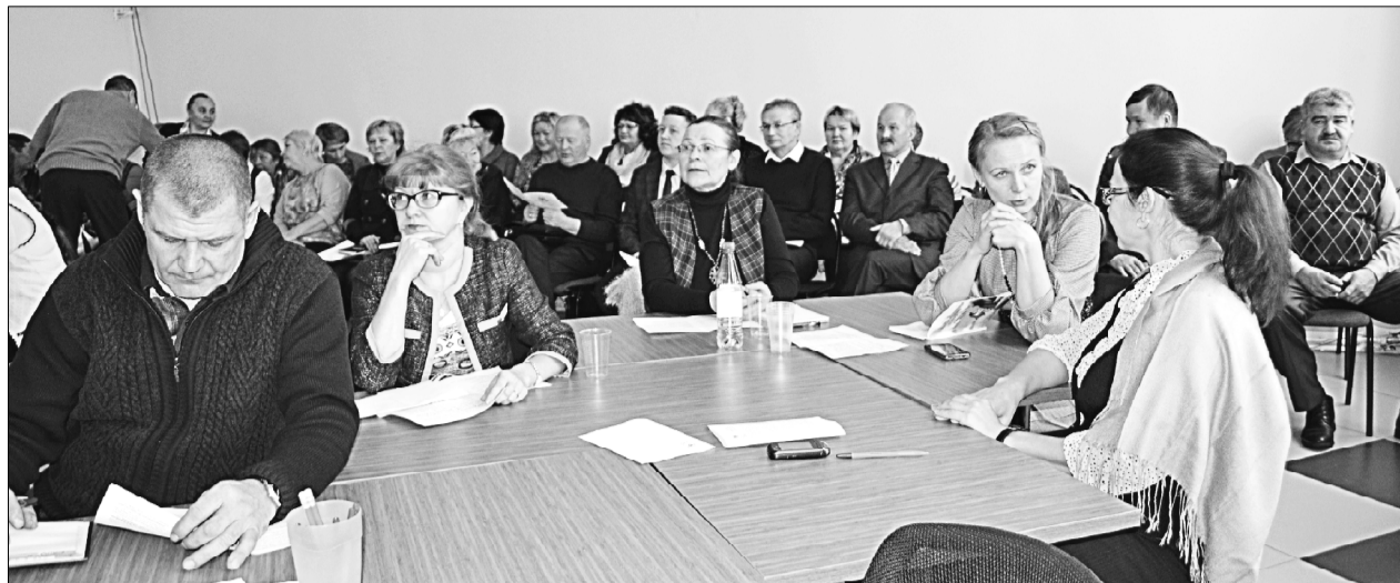
Рабочий момент конференции.