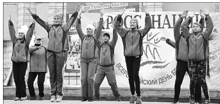
Разминка перед забегом.