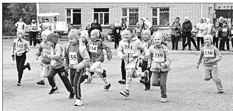
Первыми стартовали девочки 1-2 классов.