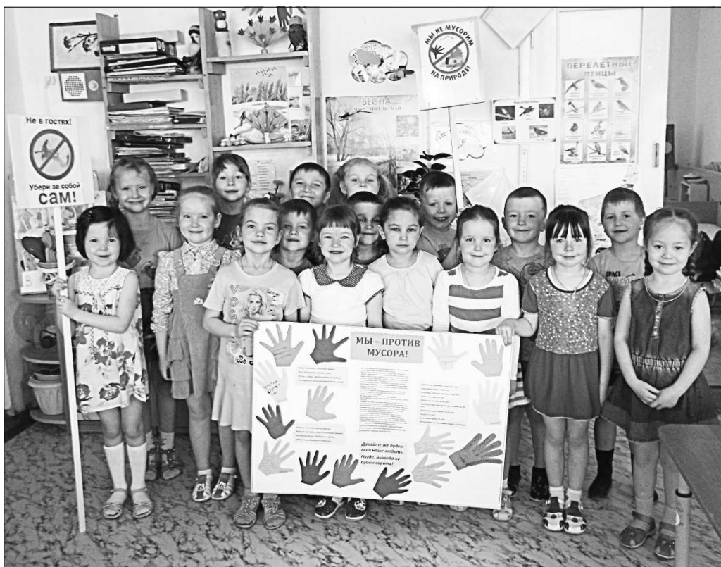
Старшая группа ДОУ №10 представляет плакаты и экологические знаки.

Воспитатели ясельной группы подготовили плакат «5 июня - Всемирный день охраны окружающей среды». Были организованы акции в 1 младшей группе - «Посади дерево», 2 младшей - «Природа - наш дом», средней - «Подари книж-