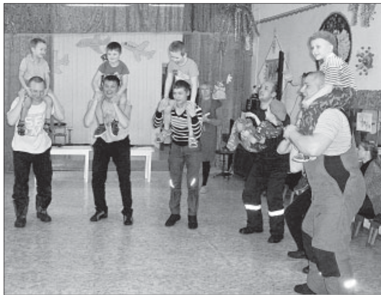
Во время конкурса.

Остальные этапы прошли на свежем воздухе. Участники ждали состязания на меткость: метание гранты, стрельба по мишеням из пневмати-