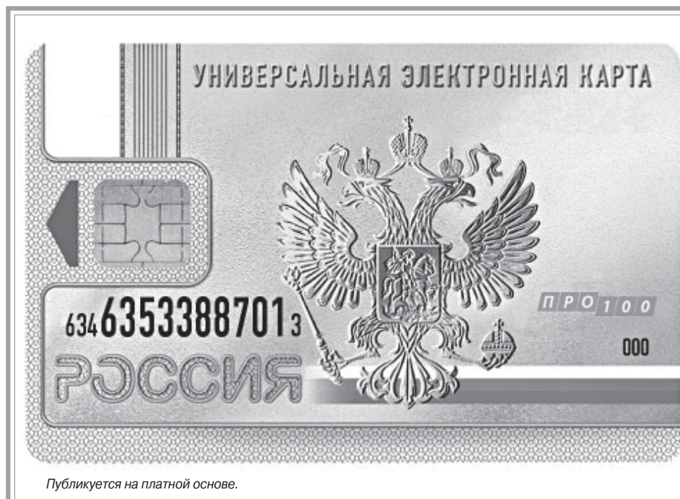
Публикуется на платной основе.

Обязательная выдача универсальных электронных карт (УЭК) гражданам Российской Федерации перенесена на год. В конце 2013 года соответствующие изменения были внесены в Федеральный закон №210 «Об организации предоставления государственных и муниципальных услуг».