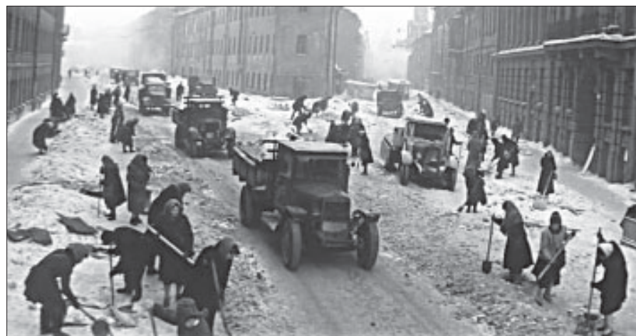
Кадры из фильма «Зимнее утро».

Перед показом кинокартин о страшных годах блокады