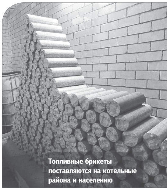
Топливные брикеты поставляются на котельные района и населению