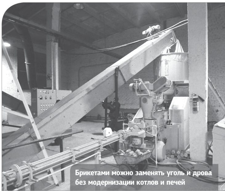
Брикетами можно заменять уголь и дрова без модернизации котлов и печей