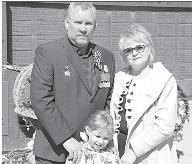
Супруги Яковлевы с внучкой. 2015 г.

Все эти данные о А.И. Митюшеве включены в III том фотоальбома «Фронтовики Республики Коми», изданном в 2000 году.