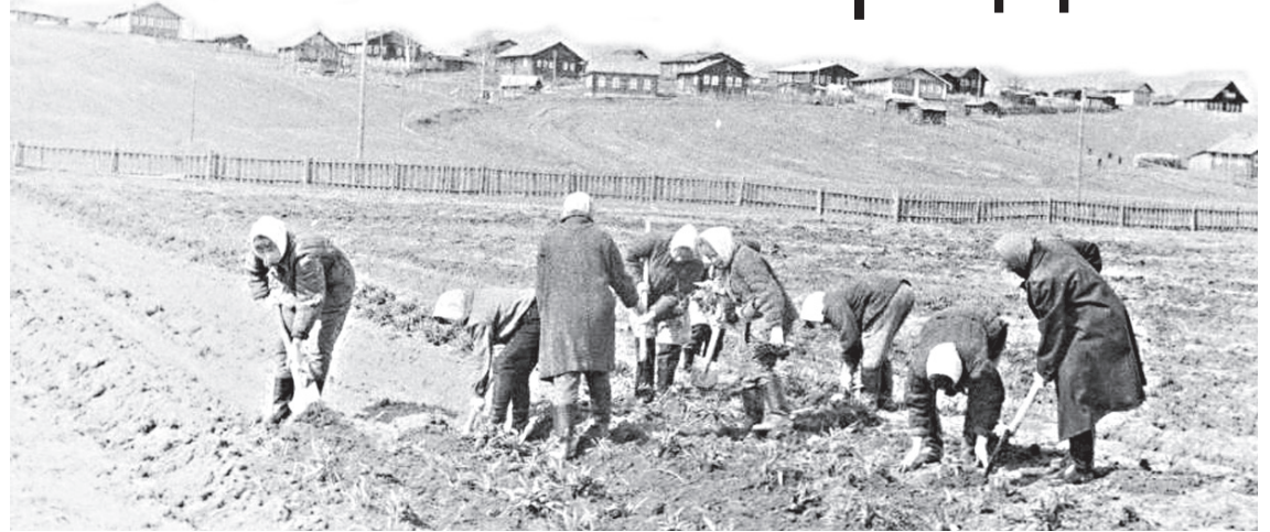
Вид на д. Звенигород, 60-е годы XX века.