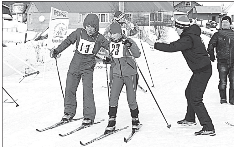
На передаче эстафеты представители Кунибского ПНИ.