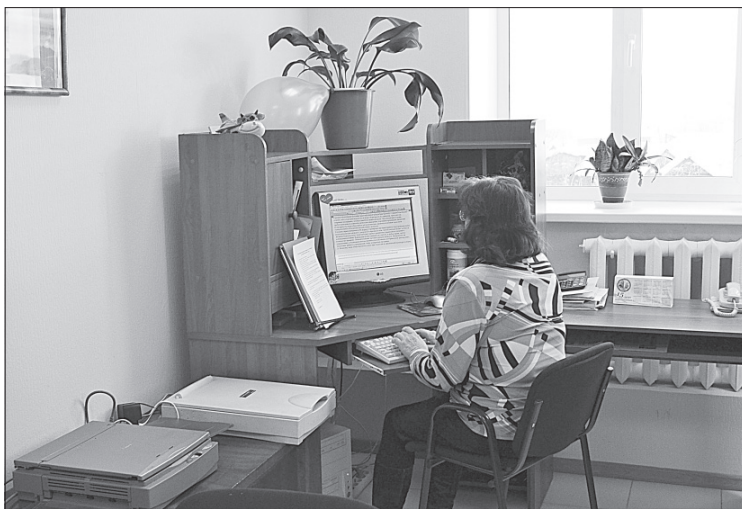
Работа в новых условиях.

В ПРЕДДВЕРИИ профессионального праздника журналистов - Дня российской печати - состоялось официальное открытие нового офиса редакции газеты «Маяк Сысолы».