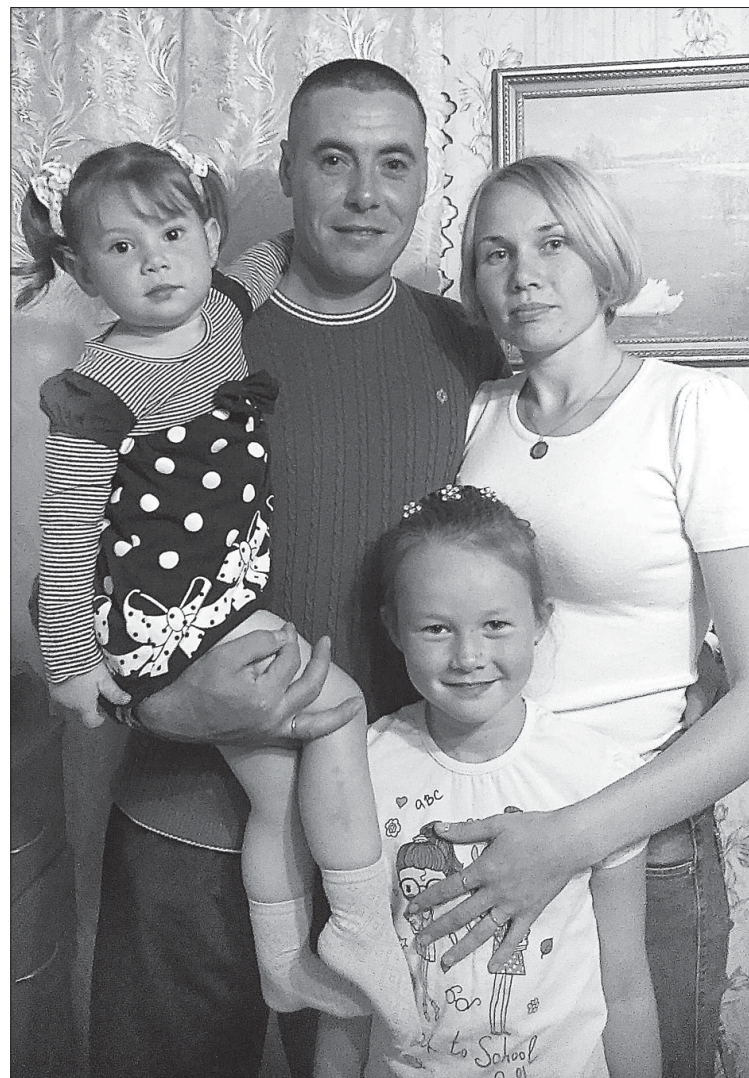
Любимая семья в сборе.

В строительстве дома мне определена роль дизайнера и генератора идей. Сейчас в магазинах множество строительных и отделочных материалов