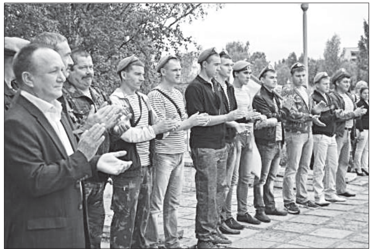
Во время праздничного митинга в райцентре.

Состоялся торжественный, праздничный митинг. В ходе этого памятного мероприятия звучали слова приветствий и поздравлений с праздником,