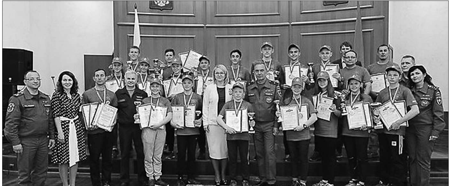
Победители на торжественном приёме в Администрации Главы Республики Коми.

До выезда на соревнования тренерами были организованы учебно-тренировочные сборы на туристической базе «Пристань туриста».