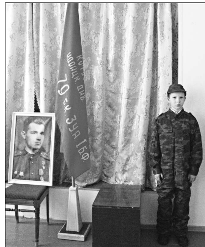
Дневальный на посту.

Во время встреч с коллективами преподавателей и учащимися, студентами конкурсная комиссия демонстрировала фильм о современной Рос-