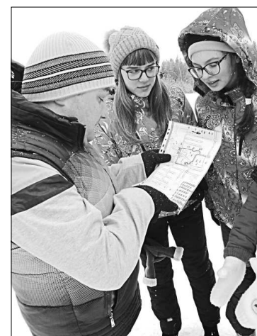
На конкурсном этапе.

Все остались очень довольны таким завершением месячника. В заключение мероприятия посетили обелиск