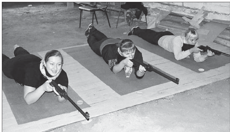
Представители детского сада №9 с. Визинга на стрельбе из пневматической винтовки.