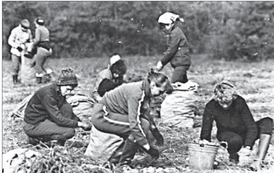
Студенты на уборке картофеля.