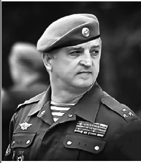
Член Правления КРО «Российский Союз ветеранов Афганистана»