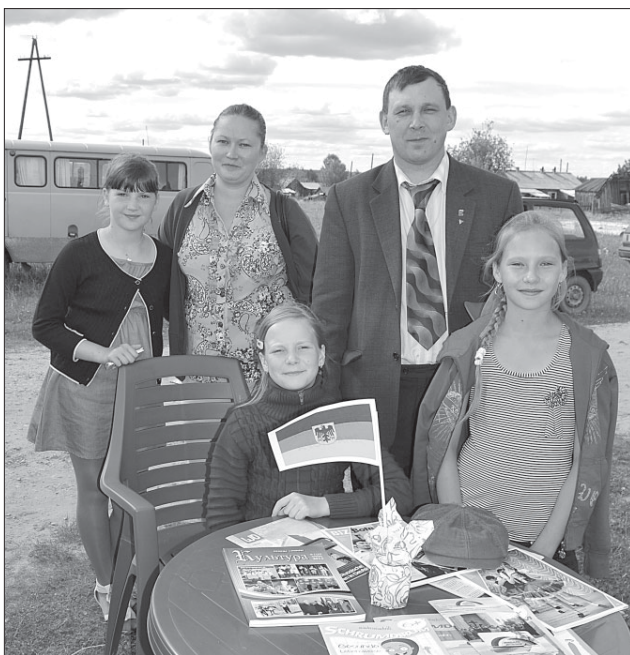
Представители немецкой диаспоры.