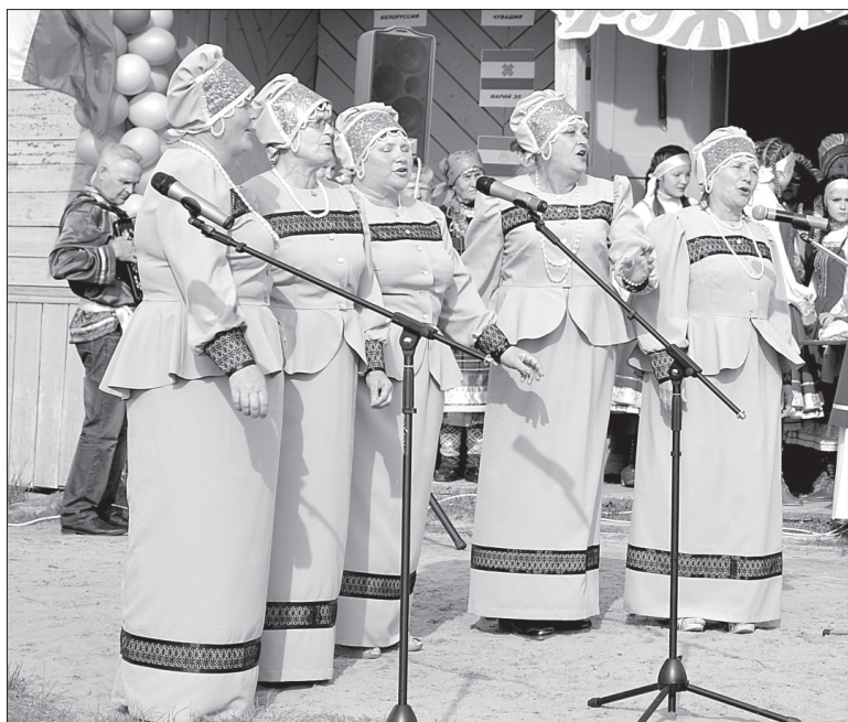
Вокальная группа «Молодушки» из п. Исанево.