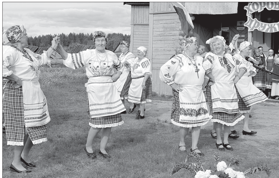
Гопак в исполнении коллектива «Подруженьки».