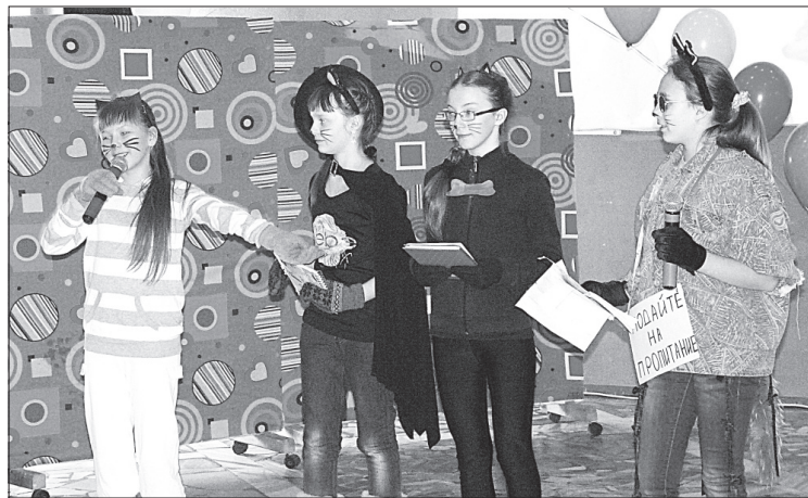
Группа «Мудрые коты».

«По страницам летнего календаря. Июнь» - так называлась познавательно-игровая