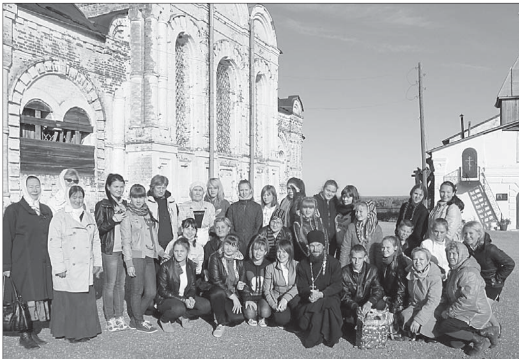
Участники чтений возле храма Нерукотворного Образа Спаса.

Раньше чтения проходили в Помоздине, в селе, где находится место упокоения о. Дмитрия Спасского (1878-1918 гг.), причисленного к лику святых Русской Православной церковью. В