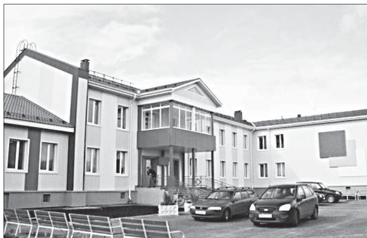
Первомайская школа сегодня.