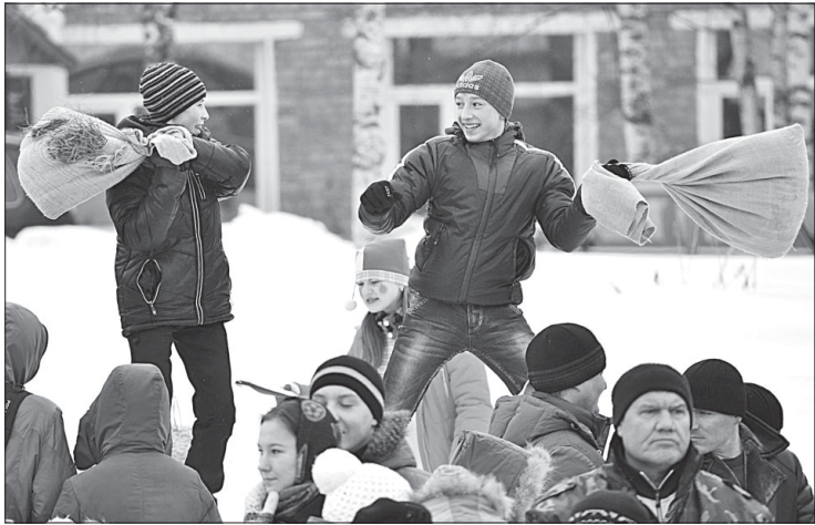
Бой на бревне.