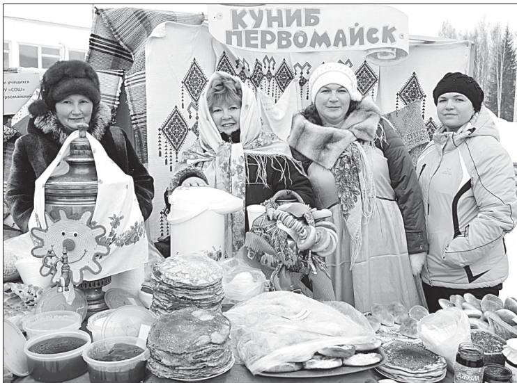
Подворье сельского поселения «Куниб».