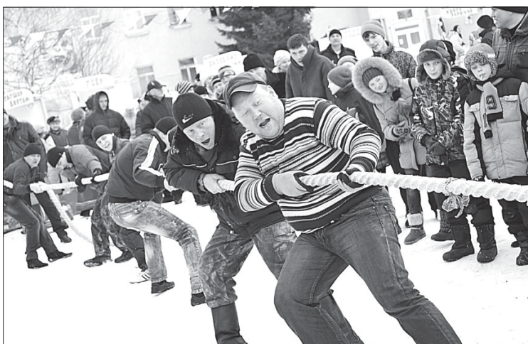
Работники Сысольского филиала КТК.