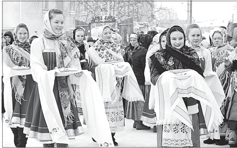
Участницы детских коллективов РДК приветствуют гостей.