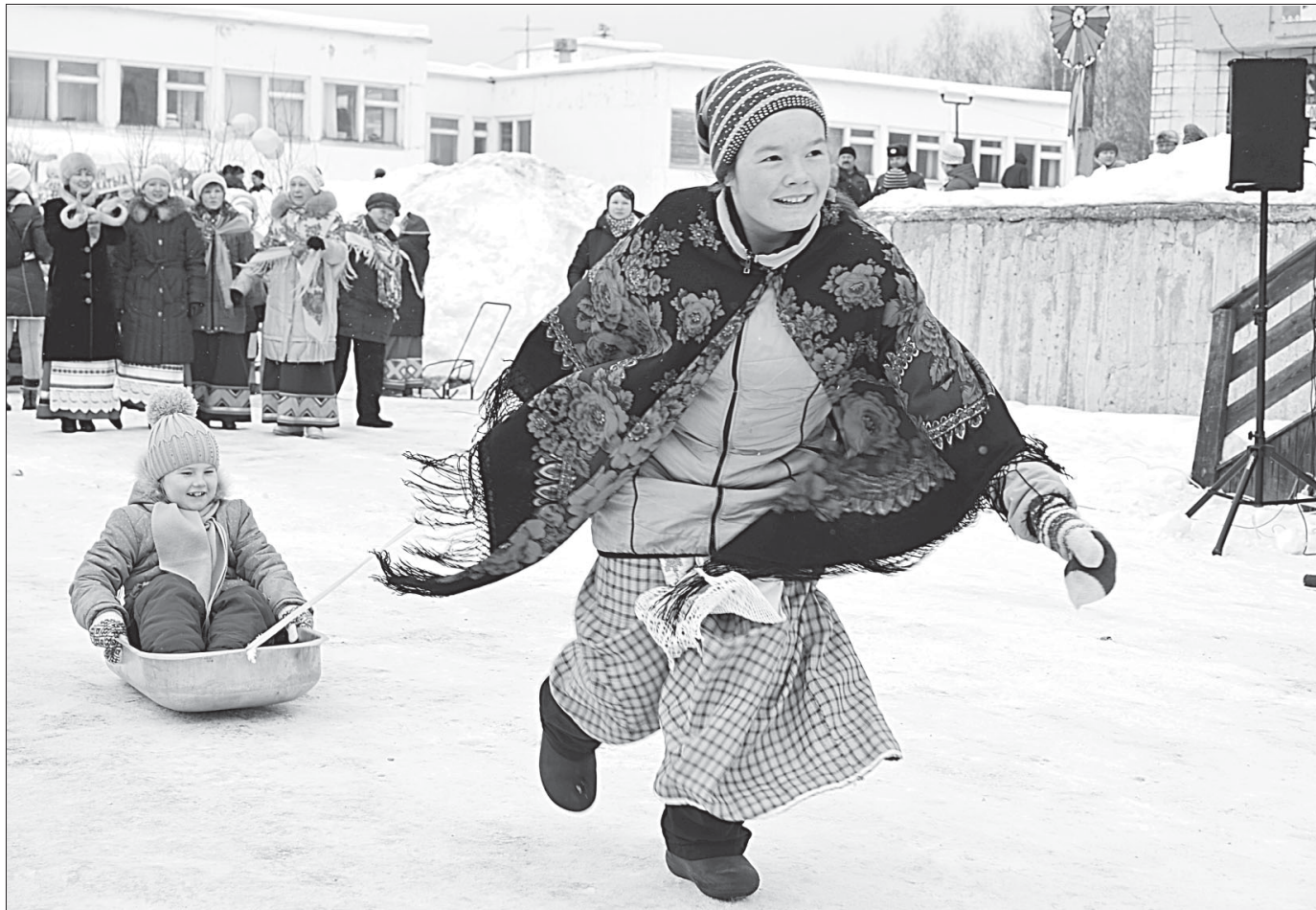
В райцентре состоялся традиционный народно-обрядовый праздник «Гажа валяй». Материал о большом культурном событии, знаменующем окончание зимы, читайте на 2-й стр.