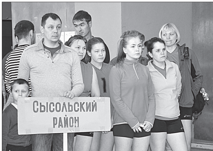
Сборная Сысольского района.

В РАЙЦЕНТРЕ состоялся уже ежегодным межрайонный турнир по волейболу, настольному теннису и шахматам на Кубок администрации МР «Сысольский». В этот раз он был посвящен Году патриотизма в Республике Коми.