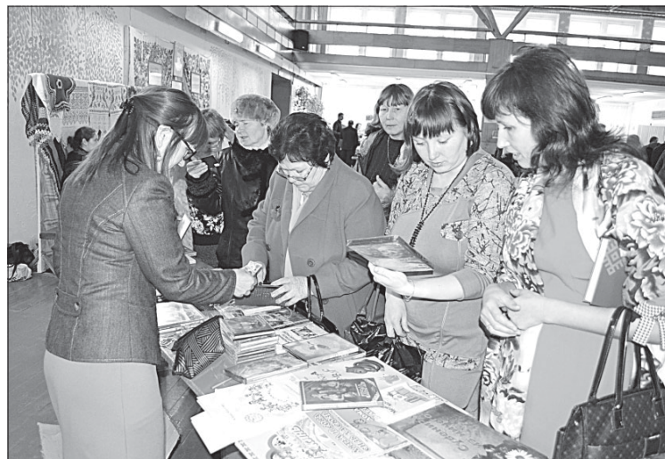
Свою продукцию предлагает Издательский дом Коми.