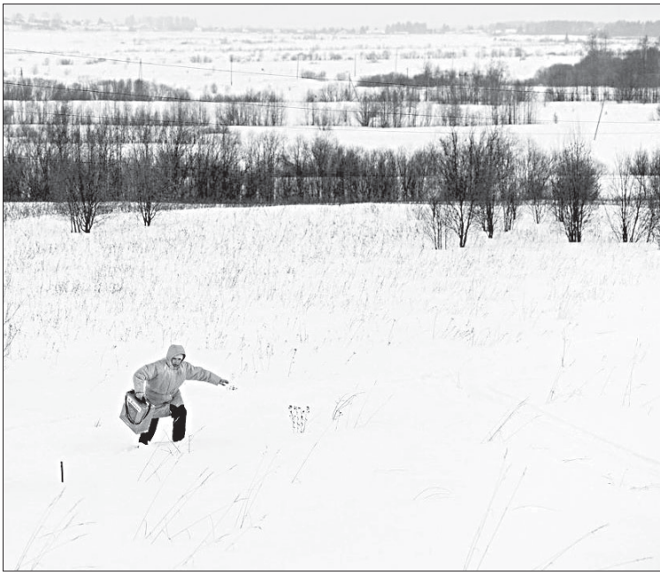
Добраться до Вадыба не так-то и легко.

КАК УЖЕ ИЗВЕСТНО читателям из более ранних публикаций, в некогда многолюдной деревне Вадыб, находящейся на территории сельского поселения «Куниб», ныне осталось постоянно проживать всего три семьи общим составом в пять человек. Все они уже пенсионеры.