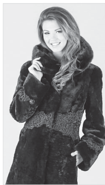
Каталог на mehabars.ru

НА ФЕВРАЛЬСКОЙ РАСПРОДАЖЕ от Вятской меховой Фабрики «БАРС» МУТОН - выгода до 10000, НОРКА - до 25000, КАРАКУЛЬ, БОБР - выгода до 15000 рублей!