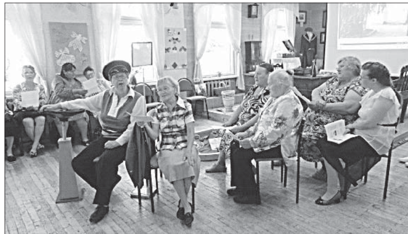
Ветераны промкомбината со своим выступлением.

В начале мероприятия с приветственным словом выступи-