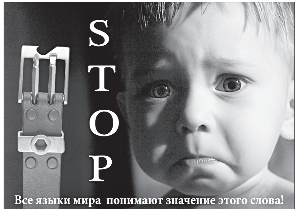
Все языки мира понимают значение этого слова!

Статья 5.35 ч.1. КоАП РФ «Неисполнение родителями или иными законными представителями несовершеннолетних обязанностей по содержанию и воспитанию несовершеннолетних» влечёт предупреждение или наложение