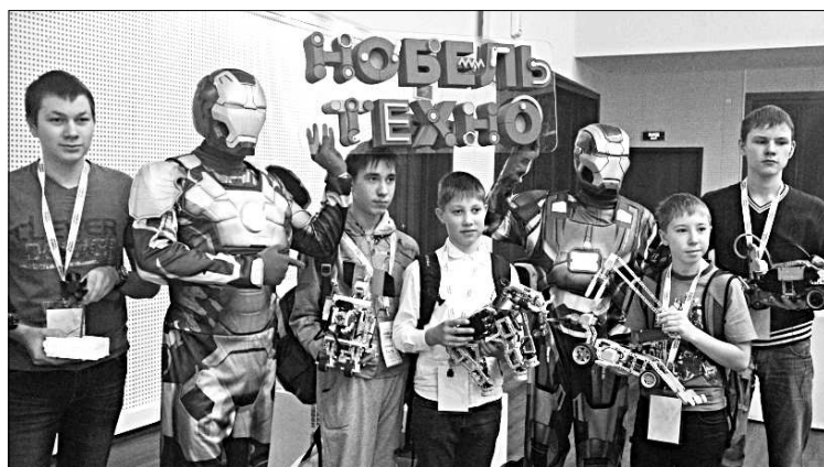
На фестивале детского технического творчества «Нобель Техно».