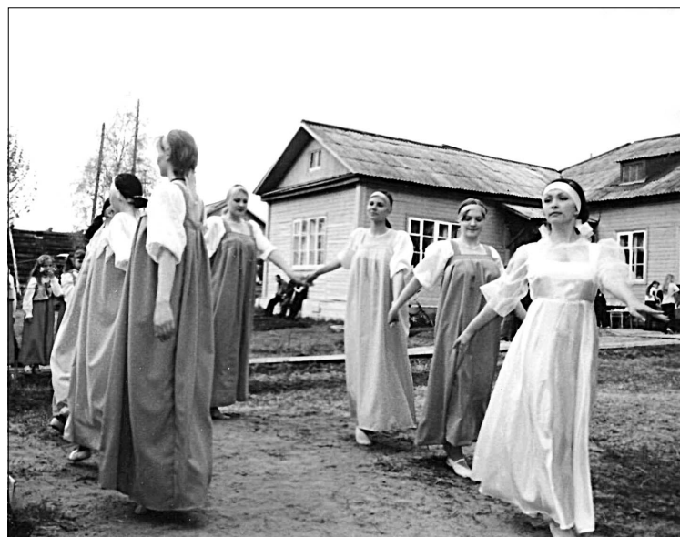
Один из первых составов ансамбля «Хуторок».

Найти и развить способности в различных видах декоративно-прикладного творчества можно в таких детских объединениях как «Рукоделие», «Бисероплетение», «Ре-