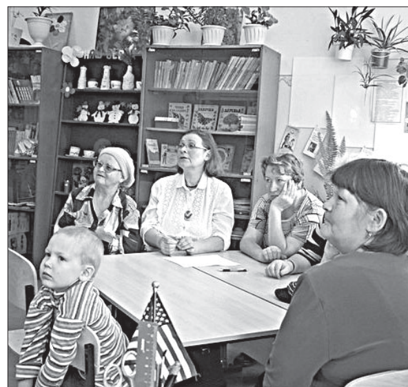
Во время встречи команд.

председатель совета ветеранов с. Межадор.