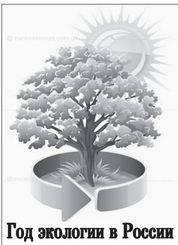
Год экологии в России

У МЕНЯ сохранились документы о численности охотничьих животных в нашем районе в 80-е годы прошлого столетия. В те годы охотнику можно было легче прожить в тайге, продавая или меняя излишки даров природы на необходимые для жизни товары. Сейчас это уже невозможно.