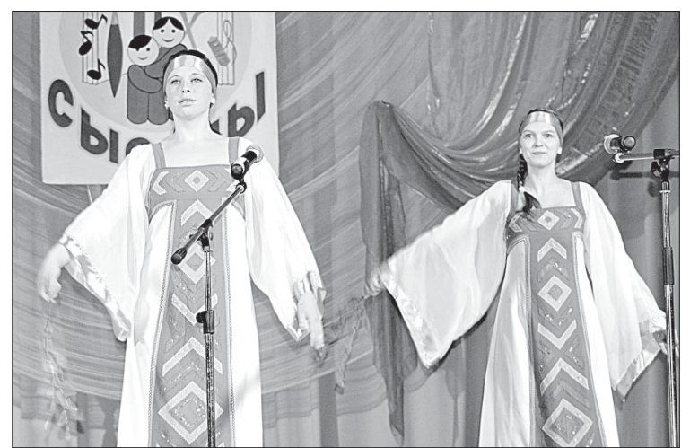
Танцевальный коллектив «Нывъяс» из с. Межадор.