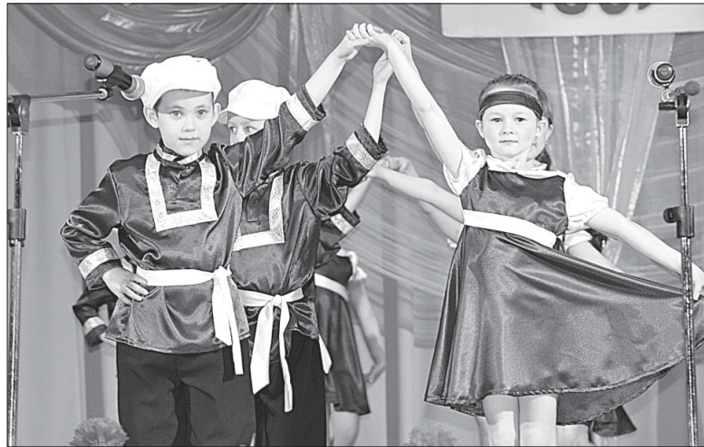
Танцевальный номер воспитанников детского сада №1 с. Визинга.