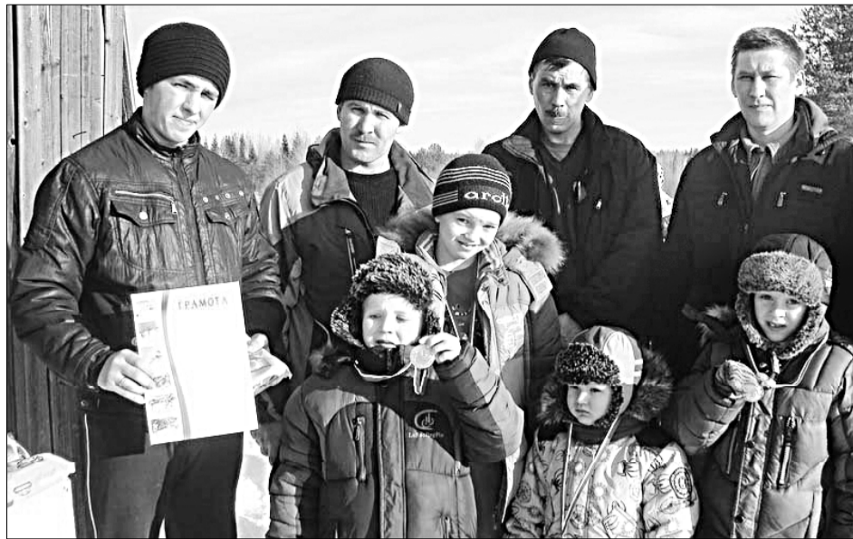
Сотрудники отдельного поста ПЧ-132 с юными спортсменами.