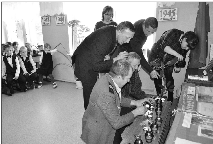
Зажжение памятных свечей.