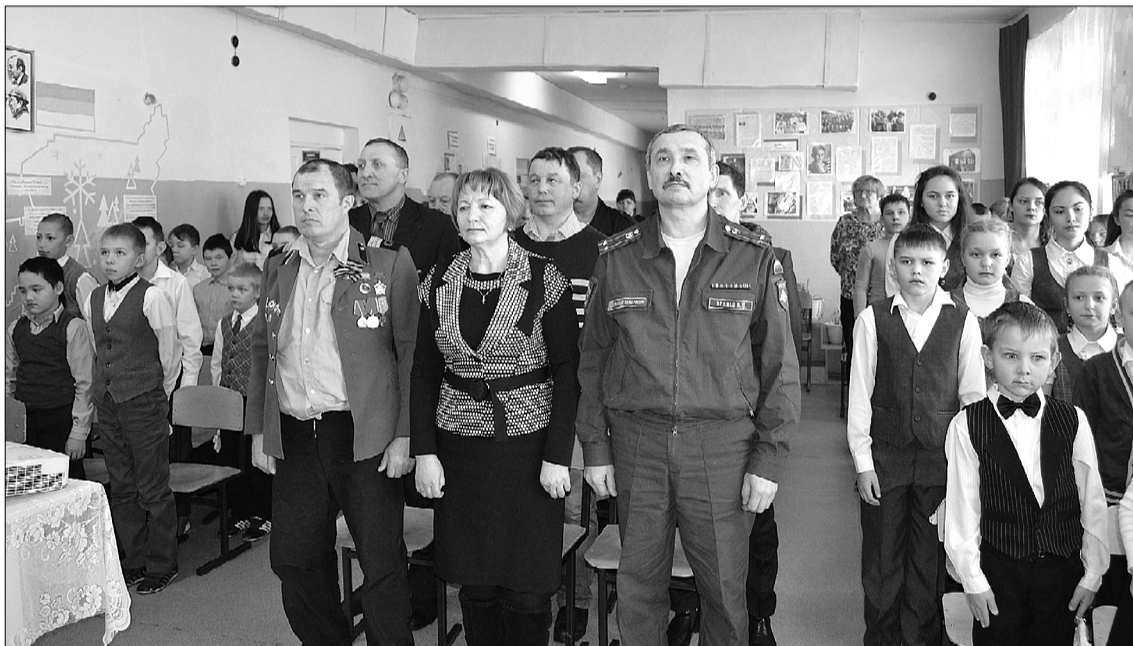
Открытие мероприятия в школе с. Межадор.