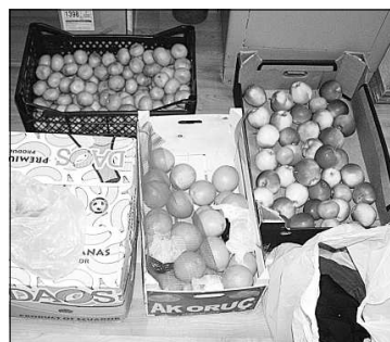
Подарки из солнечного Азербайджана.

Что касается данной поездки, то Сысольский район нами был выбран неслучайно. Дело в том, что лично я уже не раз