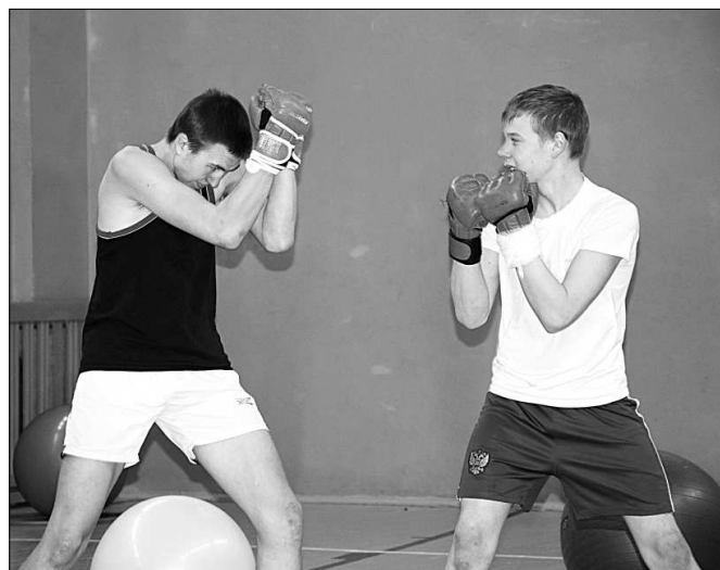
Показательные выступления боксёров из Межадора.