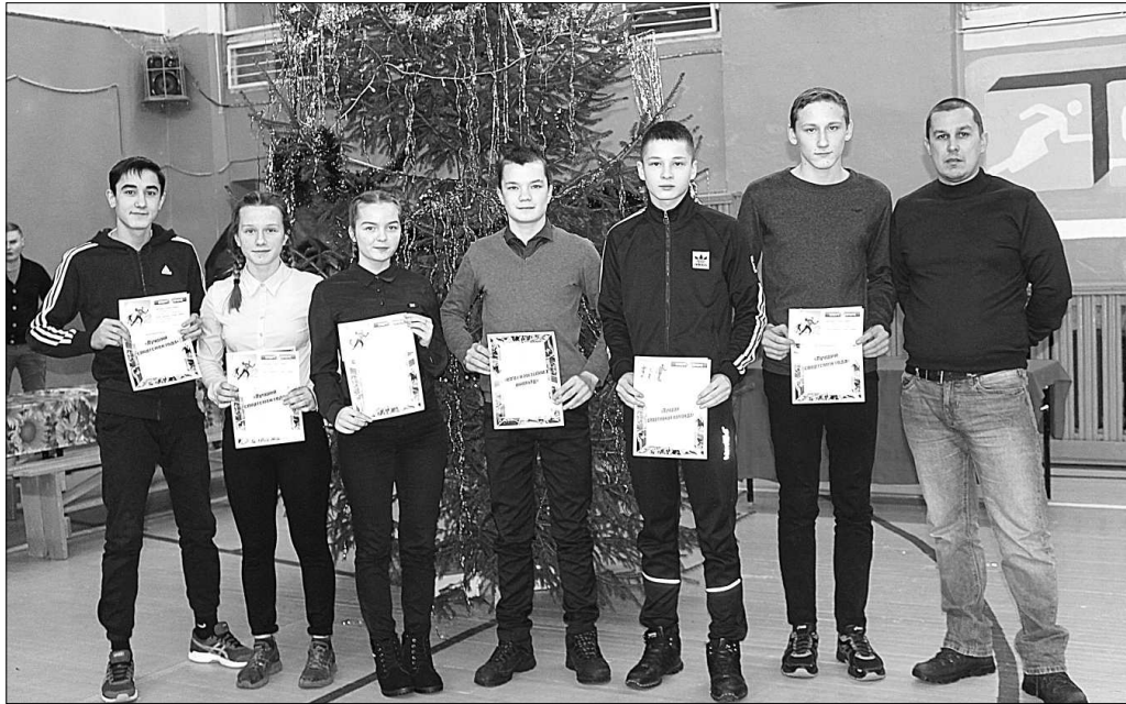
Сборная района по туризму.