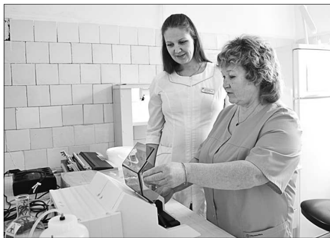
В кабинете иммунологических исследований.

Работа в лаборатории кипит. Цифры говорят сами за себя: за 2016 год было сделано более 328295 различных анализов - гематологических, общеклинических, коагулологических, микробиологических, биохимических и иммунологических. Каждый вид анализа делается в определённом кабинете. Например, есть кабинет для иммунологических исследований, в котором проводится диагностика ВИЧ-инфекции, кабинет микробиологических