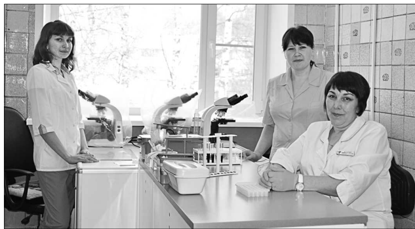
В кабинете гематологических исследований.

Конечно, если говорить об объёмах работы, то сейчас они в разы больше, чем были в начале моего трудового пути. Вспоминая те годы, когда я устроилась на работу в 1984