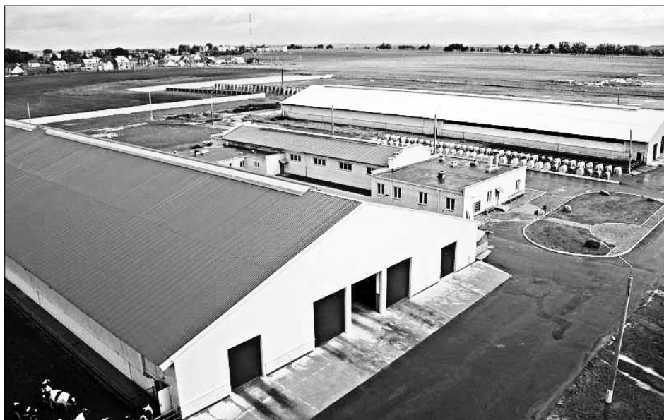
Проект животноводческого комплекса на 1200 голов в Пыёлдине.

Государственная поддержка сельскохозяйственных товаропроизводителей района в целом в общей доле их затрат в 2015 году составила 91%. В прошлом году – меньше, 76%, но на 2% больше, чем в 2014 году. В суммарном выражении выделяемые из государственной казны средства никак не удовлетворяют запросов и потребностей в них нуждающихся. Однако от реалий действительности никуда не денешься.