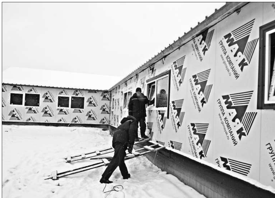
Строительство фермы в Чухлэме 2016 год.

Выше приведены лишь некоторые моменты, характеризующие деятельность тружеников агропромышленного комплекса. Конечно же, положительные конечные результаты достигаются каждодневным напряжённым трудом людей. Труд этот сопряжён с преодолением препятствий на пути к намеченному. Речь о том, что ни одно из хозяйств сегодня не находится в идеальном состоянии. Надо восстанавливать, реконструировать или строить заново животноводческие помещения, приобретать оборудование, технику и механизмы. На пути к возрождению у каждого хозяина непочатый край дел, масса идей и задумок. Нужны средства, и не малые. Наша республика и район в частности находятся в зоне рискованного земледелия. Производство сельскохозяйственных продуктов – дело вообще затратное. Властные и управляющие структуры верхнего эшелона во все времена селу уделяли пристальное внимание. Конечно, не обходится без разного рода вложений в сельское хозяйство и сейчас. Однако нынешняя ситуация в этом деле сильно отличается от прежней. Тому являются больше объективные причины, порождённые общим экономическим кризисом. И всё же в последнее время намечился крен в лучшую сторону.