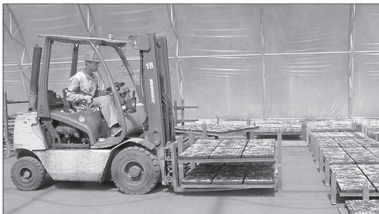
Выноска поддонов с посадочным материалом на посев.

ва ещё поработают до середины августа на пикировке и прополке второй ротации.