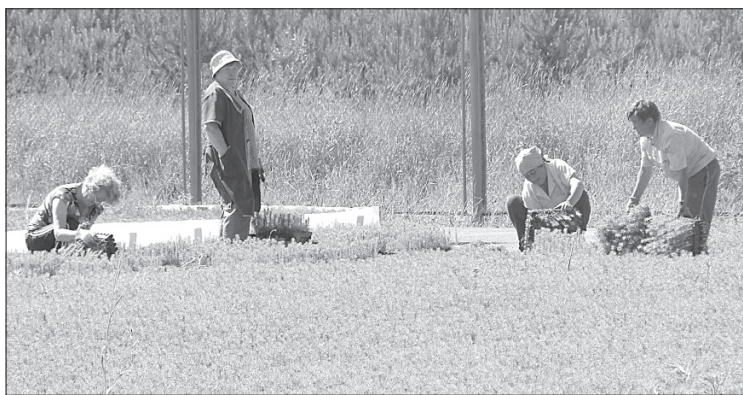
Идёт процесс расчистки корней.

Что касается юных помощников, то в дальнейшем школьники после недолгого переры-