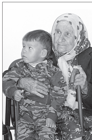
И стар, и млад.