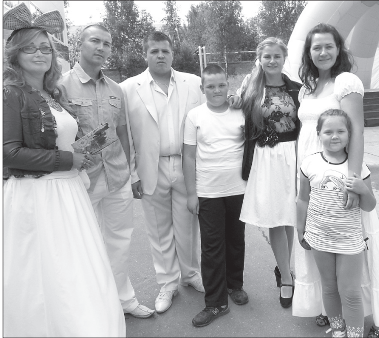
Семья Шиловых с группой поддержки.

На станции «Фермер» участники конкурса должны были перенести мячики в корзину при помощи ног, не касаясь их руками. На «Строительной» папы забивали гвозди, на станции «Кухня» ловили шляпой-корзиной фрукты-мячики. На