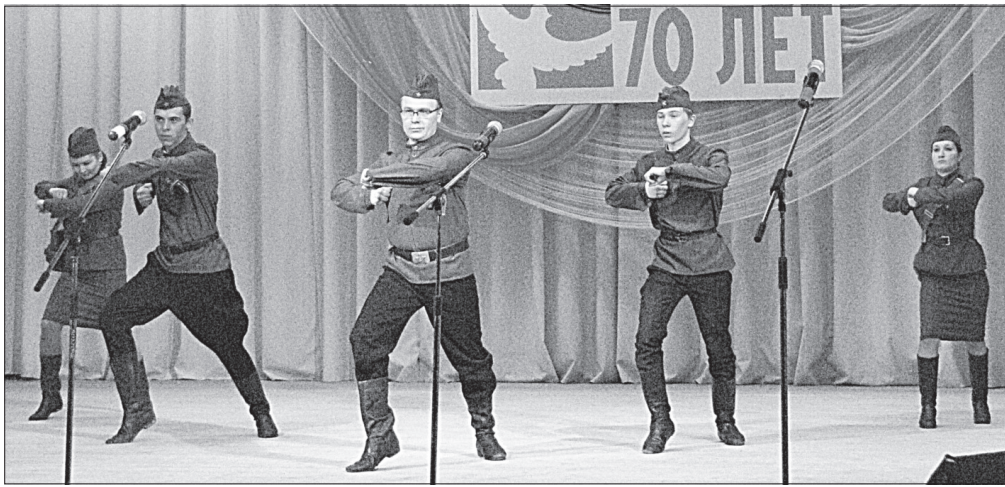
На сцене коллектив «Кадриль» из с. Чухлэм.