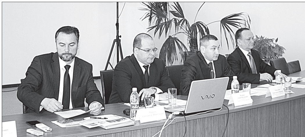
Рабочие моменты совещания.