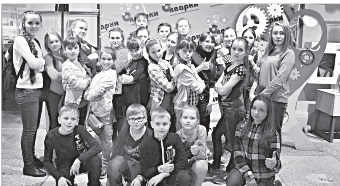
Участники фестиваля из Сысольского района.