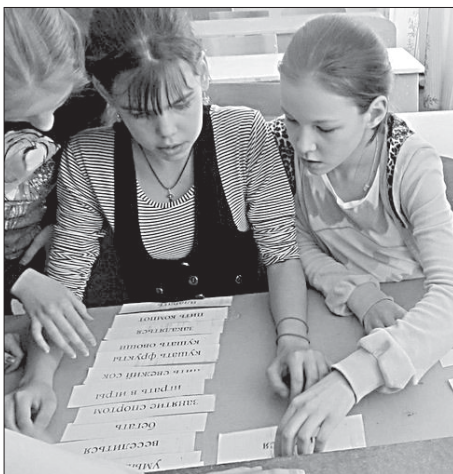
Игра по станциям «Путешествие на поезде здоровья».

В свою очередь КРОО «Ассоциация детских общественных объединений Республики Коми» входит в Международный союз детских общественных объединений «Союз пионерских организаций - Федерация детских организаций». Что это значит для нас? Это значит, что мы являемся частью междуна-