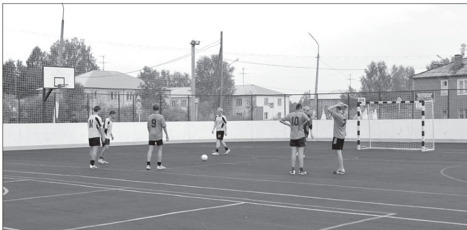
Молодежь райцентра провела на новой площадке первую игру.