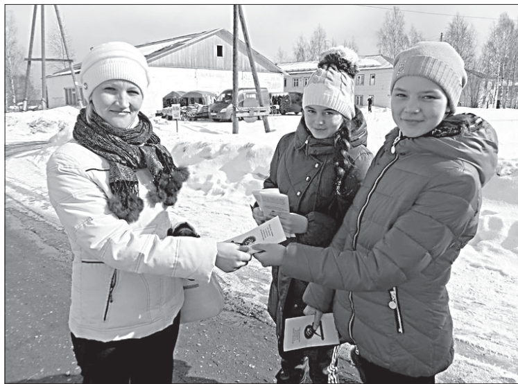
Участники акции «Здоровым быть здорово» в с. Междор.

Сотрудняем мы также с районным Домом культуры, который по необходимости предоставляет нам помещение, аппаратуру и помощь в организации мероприятий.