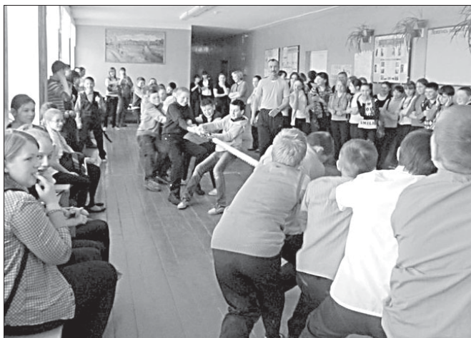
Во время Недели здоровья в Визингской школе.

родного детского движения. Это значит, что мы в содружестве с миллионом детей стремимся создать благоприятные условия для реализации интересов, потребностей детей и детских проектов, познания детьми окружающего мира, воспитания гражданина своей страны, сочетать добро и справедливость, милосердие и гуманность к каждому человеку. Чем больше будет детей, включенных в детское движение, тем больше шансов сделать мир вокруг добрей и интересней.