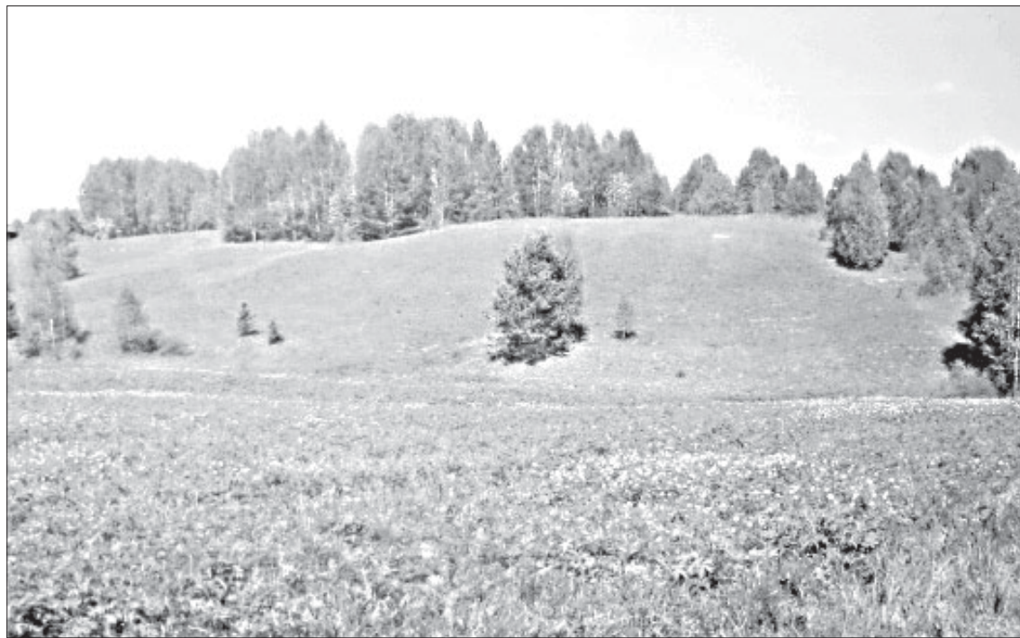
Мичабсь чукломса эрдьяс.

ровналы вöли верöслөн том дырся юöмыс. Но нывбаба сöмын бурөн вермис шедöд- ны верöссö вина гагысь. Рыт көть вой мунас корсьны, ве- сиг Ужбурысьöдз кайлас, вай- одас, пöсь шыдөн да жар пыв- сянөн пальöдас. Бурөн да ке- вмысьöмөн артмис нывбабалön да семьялön бурдöдны көзя- инсö лөк висьöмысь. Ыджыд шог лои венöма и 1995 воын- радейтана нывсö Енмыс босьтис ас дорас. Гозья кок йывсысь усылисны, но бара тай олөмыд бурдөдис-пальөдис налысь шөгсö.