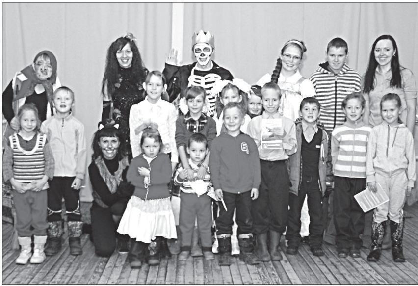
Участники спектакля с юными зрителями.