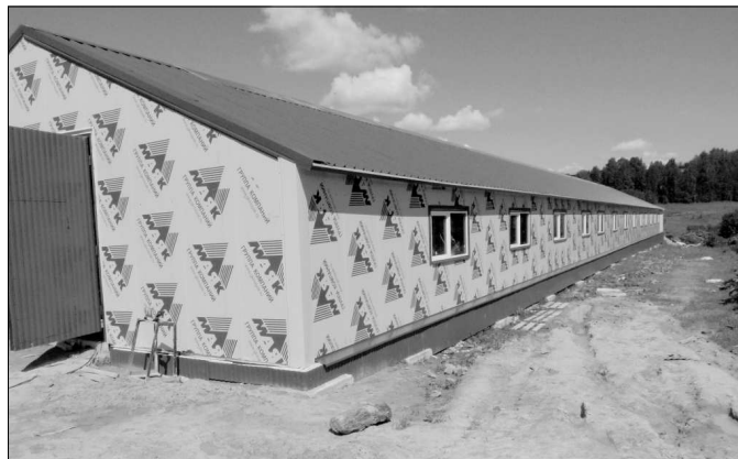
Общий вид будущего телятника.